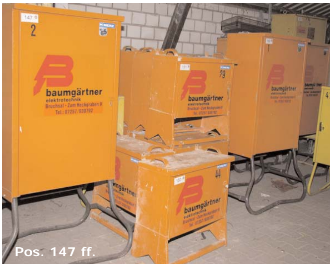
Pos. 147 ff.